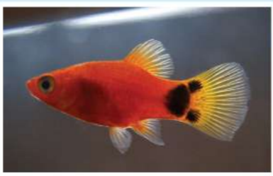
第三站「淡水養殖」飼養了俗稱「米奇魚」的熱帶魚，尾部的圖案真的很像米奇老鼠呢！

你知道教育徑裏有哪些可愛的動物？有很多呢！其中包括盾臂龜和馬蹄蟹。盾臂龜來到「梁校」前，其實有個感人的故事：一開始，主人很疼愛牠，但後來小龜逐漸長成大龜，主人意識到牠年老了，體型變大了，所以無法再飼養牠。當我善良的校長聽這個故事後，不忍心盾臂龜被丟棄，就把牠收養並讓牠到我們的學校居住。盾臂龜逃離被棄養的命運，由我們「梁校」的師生來保護牠呢！通過這個經歷，學生學到了如何愛護動物，令牠們有意義地生活在「梁校」裏。