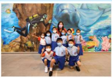
校園裏到處都有關於大自然生態的圖畫。