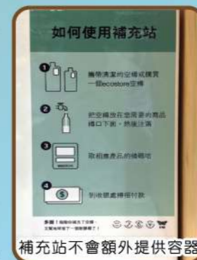
補充站不會額外提供容器