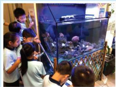
第一站「珊瑚生態」設有一個展示「鹹水養殖系統」的大型水族箱。

「梁校」積極推動常識科發展，為了讓學生體驗一個「親臨其境」的學習經歷，在校園內建設了「梁校生態教育徑」，分為「珊瑚生態」、「馬蹄蟹」、「淡水養殖」和「盾臂龜之家」四站，學生可通過觀察各種生物，學習相關科學知識。這條教育徑裏有些特別的動物供觀賞，同學都很喜歡呢！雖然身在學校，但我們依然可以通過它來了解大自然生物及保育牠們的方法。