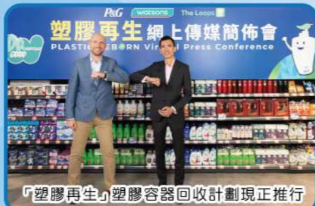
「塑膠再生」塑膠容器回收計劃現正推行

近年，有零售企業及日用品品牌推出為期三年的「塑膠再生」塑膠容器回收計劃，市民到分店交回塑膠產品器皿，可獲電子印花，集齊五個印花可兌換五元電子現金券或其他禮品。容器回收後，會再造成有用的塑膠物料，重獲第二次生命。