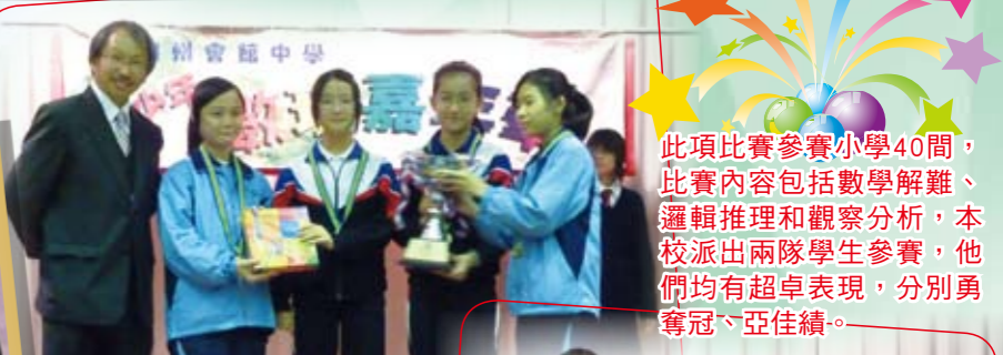
沙田區小學隊制數理比賽冠軍

此項比賽參賽小學40間，比賽內容包括數學解難、邏輯推理和觀察分析，本校派出兩隊學生參賽，他們均有超卓表現，分別勇奪冠、亞佳績。