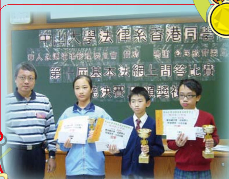
第十屆基本法網上問答比賽冠軍及季軍