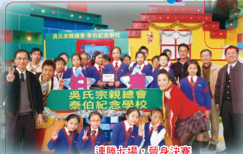
連勝七場，晉身決賽 TVB主辦智激校園2009全年總決賽亞軍