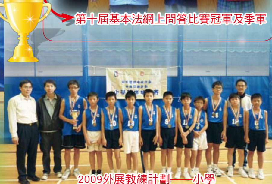
2009外展教練計劃——小學籃球挑戰賽男子組全港亞軍