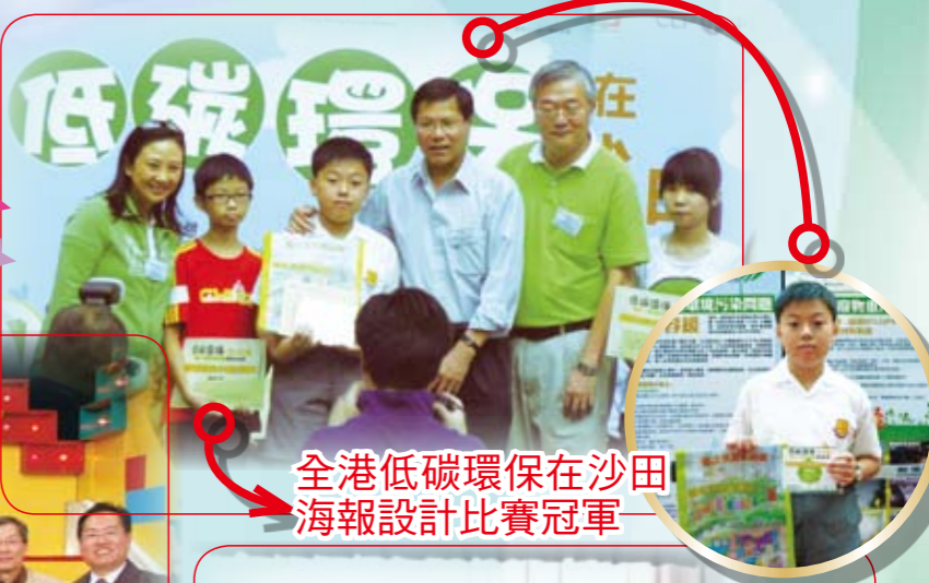
全港低碳環保在沙田海報設計比賽冠軍