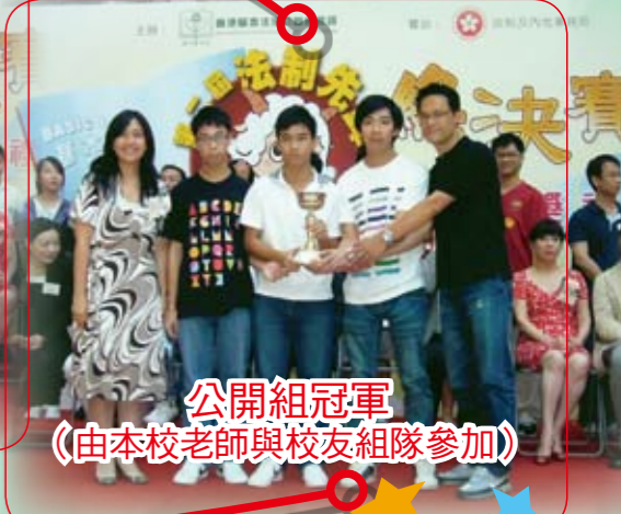
公開組冠軍 (由本校老師與校友組隊參加)