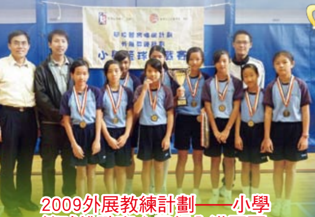
2009外展教練計劃——小學籃球挑戰賽女子組全港冠軍