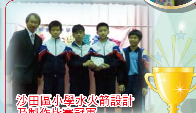
沙田區小學水火箭設計及製作比賽冠軍