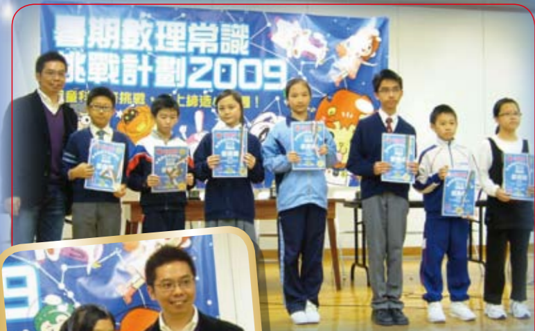
暑期數理常識挑戰計劃2009優異獎