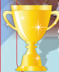
沙田區小學校際運動會男子甲組推鉛球冠軍