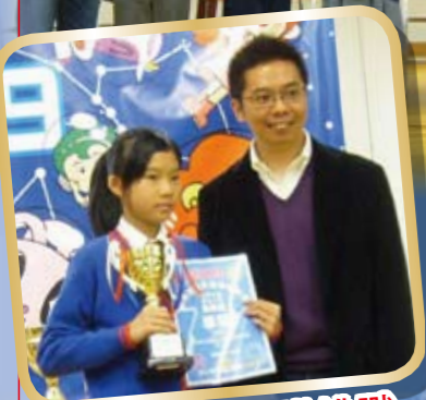
暑期數理常識挑戰計劃2009季軍