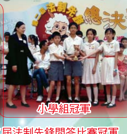
小學組冠軍 第二屆法制先鋒問答比賽冠軍