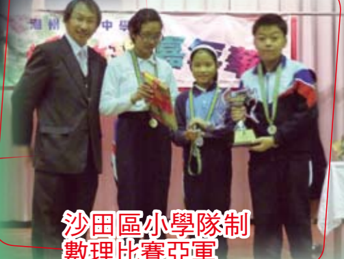
沙田區小學隊制數理比賽亞軍

此項比賽參賽小學40間，比賽內容包括數學解難、邏輯推理和觀察分析，本校派出兩隊學生參賽，他們均有超卓表現，分別勇奪冠、亞佳績。