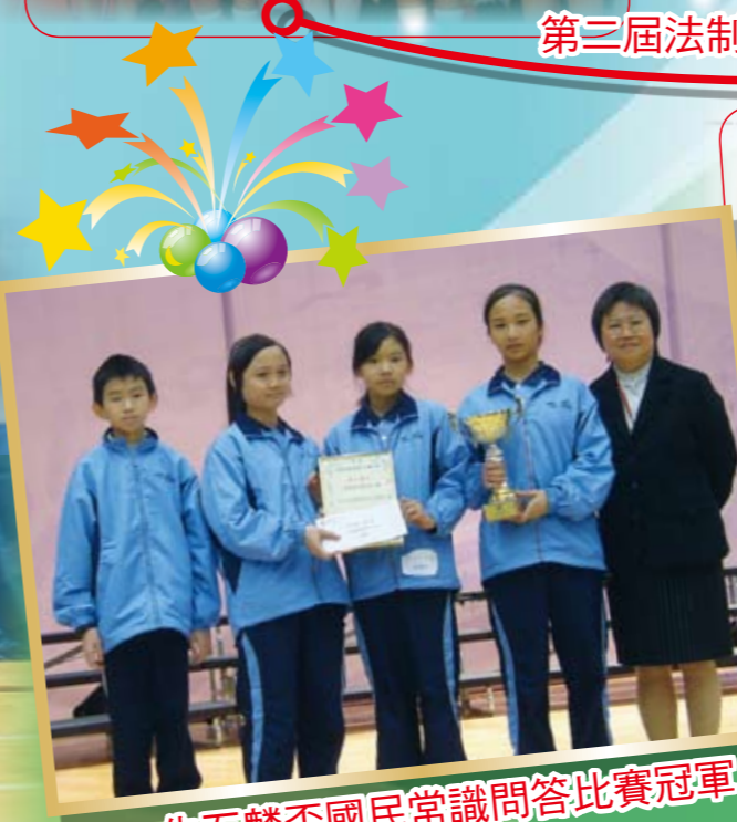
朱石麟盃國民常識問答比賽冠軍