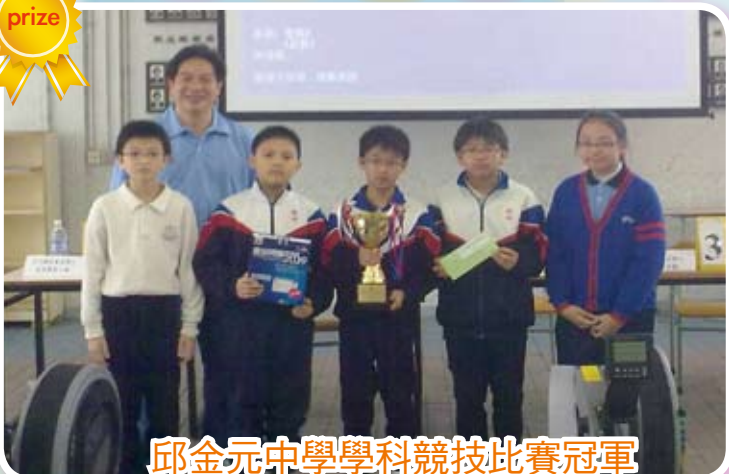
邱金元中學學科競技比賽冠軍