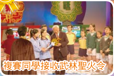
複賽同學接收武林聖火令