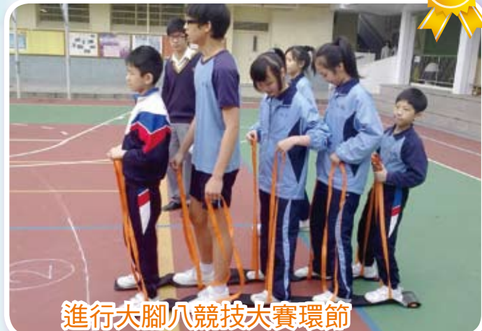
進行大腳八競技大賽環節