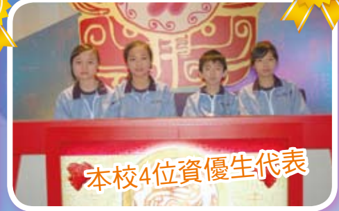
本校4位資優生代表