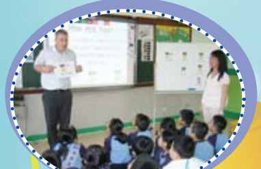
劍橋大學英語課程